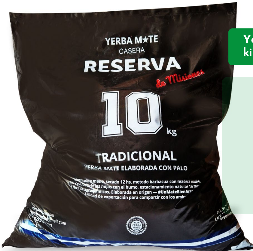
Yerba Mate Canchada 10 kilos - Reserva de misiones

Cosechada a mano, secado 12 hrs, método barbacua con madera noble, sin contacto de las hojas con el humo, estacionamiento natural 18 meses-libre de agroquímicos- Elaborada de Origen