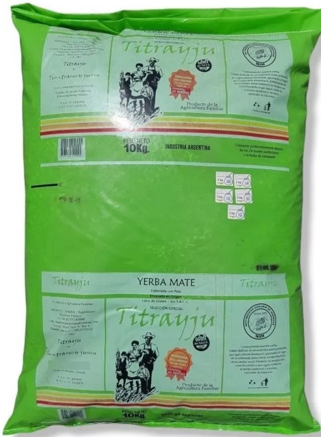
Yerba Mate Canchada 10 kilos - Titrayju